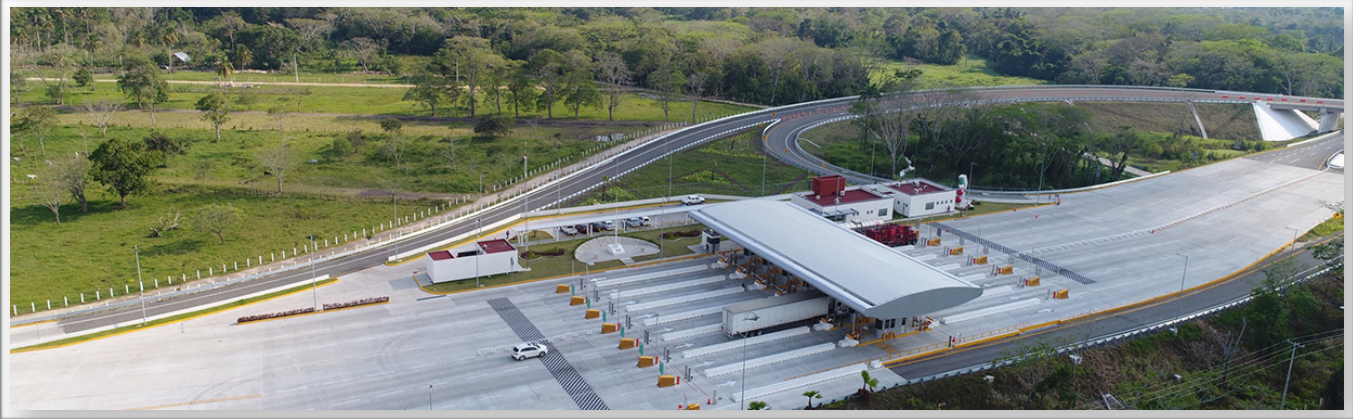
Libramiento de Villahermosa, Cárdenas-Nacajuca, Marhnos.

La Cámara Mexicana de la Industria de la Construcción y el Consejo Coordinador Empresarial realizaron 9 foros de consulta sobre la infraestructura. En ellos participaron funcionarios, legisladores, organismos internacionales, académicos, especialistas, empresas y organismos de la sociedad civil. Como resultado de dichos trabajos e investigaciones, se reconoció que México necesita incrementar la inversión en infraestructura a fin de contar con una plataforma logística y productiva más competitiva. Asimismo, se subrayó la importancia de asignar y ejercer dicha inversión de manera más eficiente.