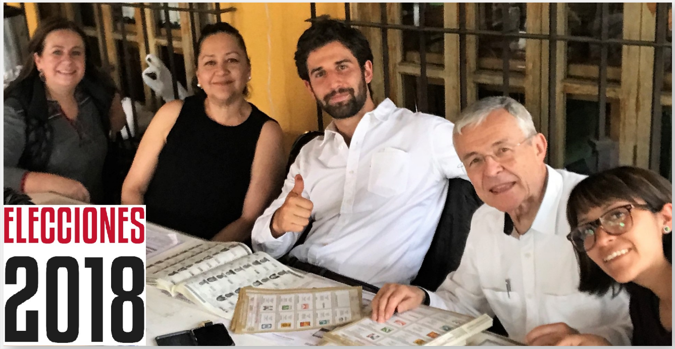
Funcionarios de casilla 1 de julio 2018.