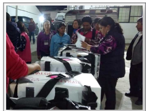
Entrega de paquete electoral al final de la jornada.

En la casilla en la que tuve oportunidad de participar, (y en general en el resto del país), hubo un ambiente de orden, respeto y civilidad. Fue una jornada electoral pacífica y muy participativa. Yo recibí alrededor de 620 boletas, de las cuales se usaron aproximadamente el 75%. En nuestra casilla ganó el PAN en todo: presidencia, senadurías, diputaciones, jefatura de gobierno y alcaldía.